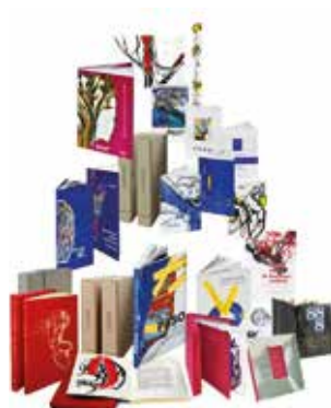
PASO, publication d'ouvrages d'art

Sous la superposition de ces lignes de Vie(S), l'artiste entre en scène rigoureusement fidèle à lui-même : hors du temps et pourtant tellement dans son temps.